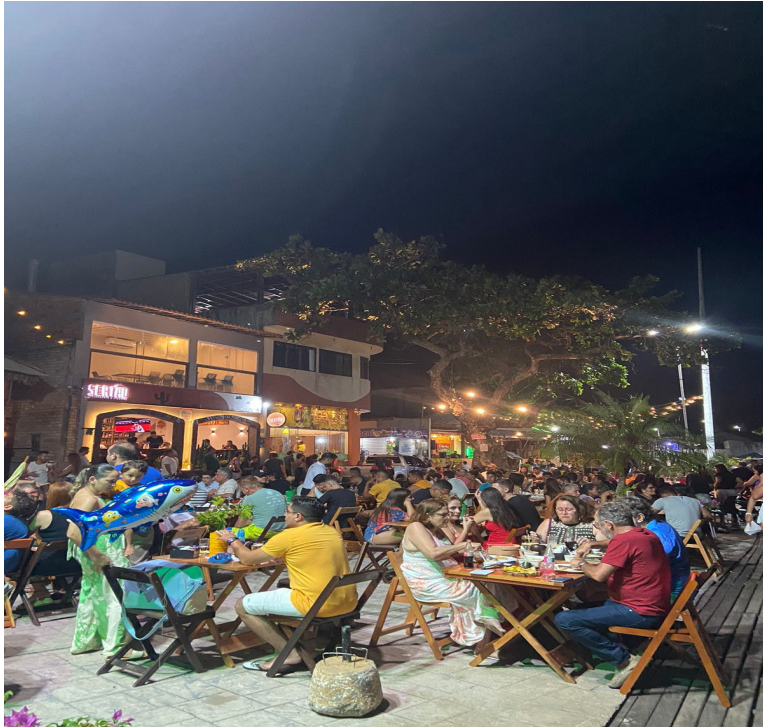
Figura 1 – Bares da Beira Rio em Barreirinhas