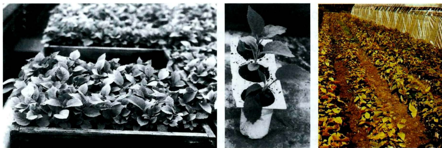
Figura 7 - Sementeiras de kiwi (à esquerda), repicagem (ao centro) e semeadura em canteiros (à direita) (Coque Fuertes & Díaz Hernández, 2001)

Quando da produção de mudas via sementes, estas devem ser retiradas de frutos maduros, lavados e secados. As sementes podem ser semeadas imediatamente ou conservadas a 4°C. Sendo que a semeadura pode ser feita em canteiros, sacos plásticos ou tubetes (Figura 7). O primeiro caso exige posterior repicagem, para separação e seleção das plântulas.