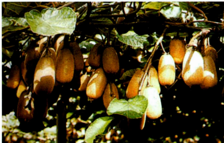
Figura 5 - Frutos do cultivar Monty

Schuck (1992) descreve este cultivar como produzindo mais de uma flor por inflorescência. Os frutos são oblongos e cobertos de uma densa camada de pêlos longos.