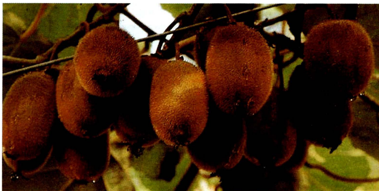
Figura 2 - Frutos do cultivar Allison

São cultivares produtivos, aparentemente oriundos de uma mesma variedade, e de difícil separação varietal. Ambos são precoces, com baixa exigência em frio. Seus frutos são oblongos e de bom sabor, recobertos por pêlos longos e macios (Figuras 2 e 3) (Simão, 1998).