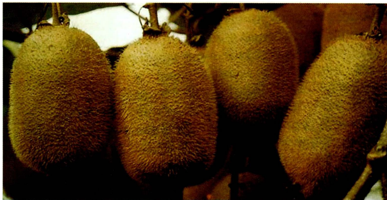
Figura 3 - Frutos do cultivar Abbott