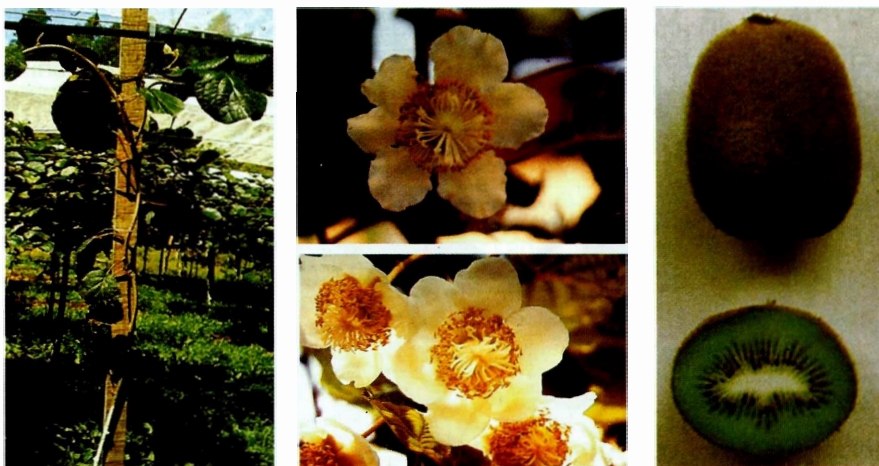
Figura 1 - Características da planta de kiwi, das flores masculinas (em cima) e femininas (embaixo), do fruto e corte transversal do mesmo (Silvestrin, 1994)

Na figura 1 apresentam-se algumas características da planta, flores e frutos do kiwizeiro.