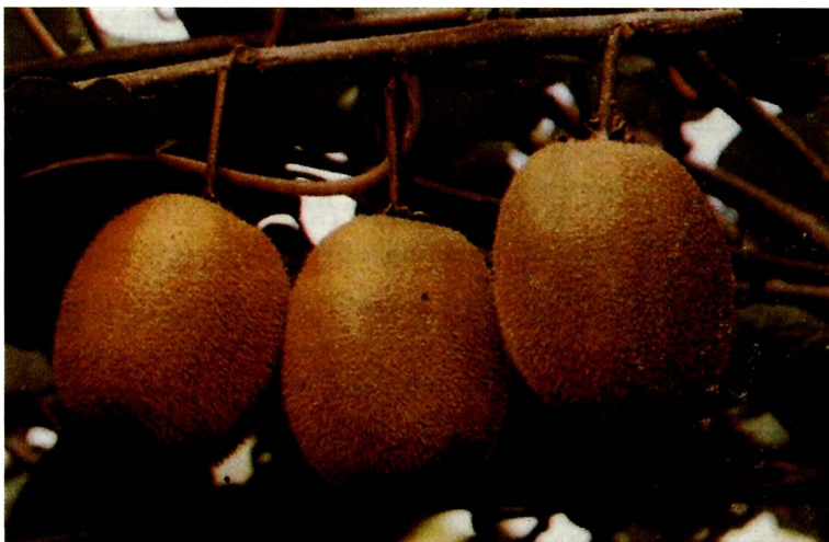
Figura 6 - Frutos do cultivar Hayward

É mais exigente em horas de frio, exigindo cerca de oitocentas horas de frio abaixo de 7,2°C no inverno para quebra de ecodormência, enquanto os demais cultivares exigem cerca de quatrocentas a quinhentas horas de frio para tal.