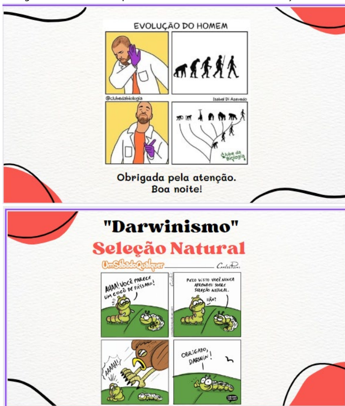
Elaborados pela autora.