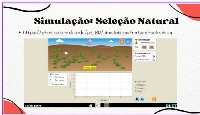
Imagem 2: Ferramenta utilizada para ilustrar a Seleção Natural - https://phet.colorado.edu/pt_BR/simulations/natural-selection