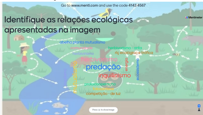
Imagem 5: Atividade síncrona no Mentimeter.

Dentro desse contexto, há ferramentas de interação síncrona. Trago o exemplo de uma conhecida como Mentimeter , ao fim da aula de Relações Ecológicas, passei um link para os alunos acessarem e responderem algumas perguntas (como na imagem a seguir), o bacana é que elas aparecem na hora e não precisa de identificação pessoal. É uma boa ferramenta para que os alunos mais tímidos também interajam e participem, uma forma de avaliação e devolutiva da aula para o professor.