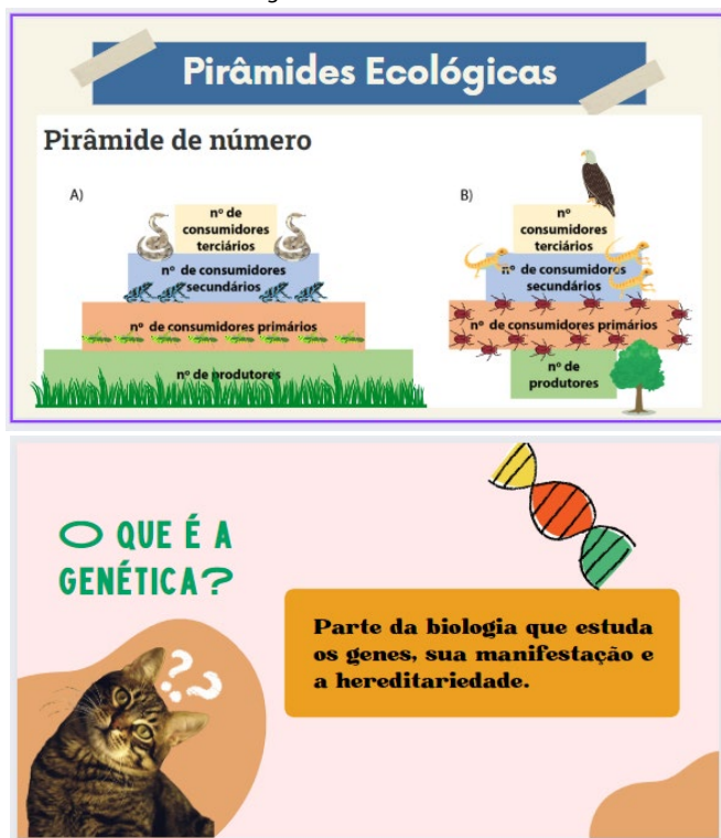
Imagem 3: Slides ilustrativos

Além disso, procuramos vídeos, animações, figuras que complementam não só as aulas, mas fora delas, em alguns momentos há sugestões de leituras e vídeos ao fim da aula ou durante a semana são postados como um extra, para aqueles que tiverem curiosidade e interesse em aprofundar algum dos assuntos.