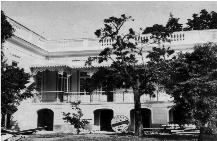
Fig. 6 – Sede do ISEB, na Rua das Palmeiras, Bairro de Botafogo, Rio de Janeiro-RJ, 1955