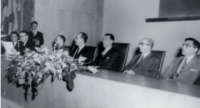
Fig. 5 – No ISEB, aula inaugural, 1956