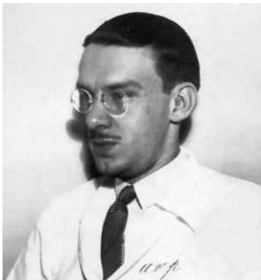
Fig. 1 – Álvaro Vieira Pinto quando jovem adulto