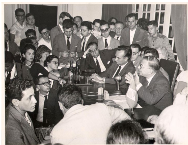
Fig. 8 – Encontro com Sartre