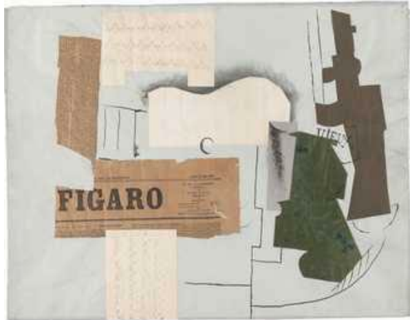
PICASSO, P. Bottle of Vieux Marc, Glass, Guitar and Newspaper . Papier Collé, 1913. (Disponível em: https://www.tate.org.uk/art/art-terms/p/papier-colle . Acesso em: 14 maio 2020 (adaptado)).