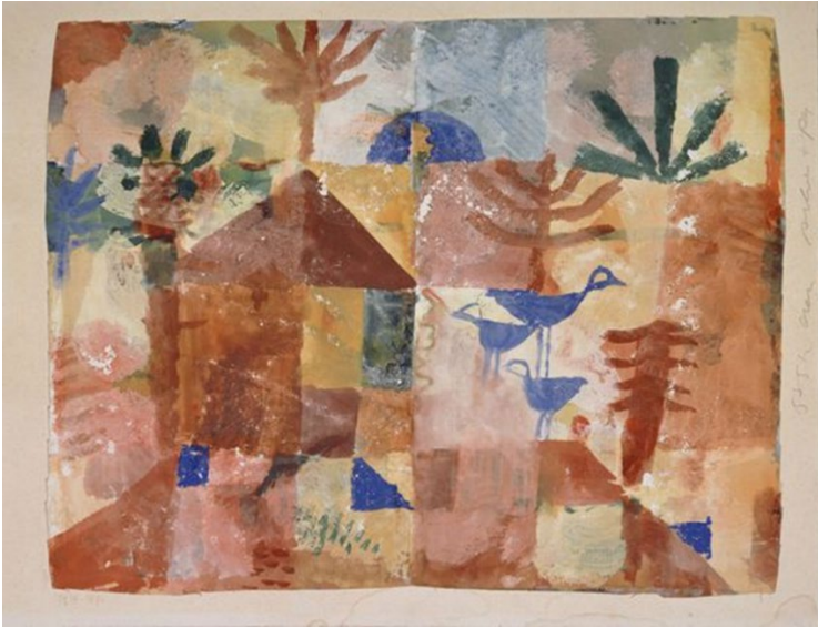
Paul Klee - Southern (Tunisian) gardens 1919

No terceiro e último encontro que tive com estes estudantes, já mais ambientado com o pensar daquele grupo e percebendo o alto valor de suas intervenções e produção, resolvi submetê-los a um desafio derradeiro.