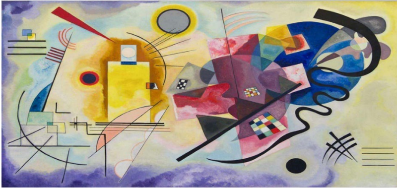
(Amarelo, Vermelho, azul – Wassily Kandinsky – 1925)

Fui me aproximando do prédio da Universidade e me impregnando com aquela atmosfera acadêmica encantadora. Quando passei pelo portal fui surpreendido com o jardim interno. Era um quadrilátero rodeado por corredores protegidos por arcos. Um prédio muito antigo, mas muito bem conservado. No outro extremo do corredor enxerguei um grupo de pessoas que conversavam. Fui caminhando até eles; poderiam ser os estudantes que me aguardavam. Ao me aproximar constatei que era, exatamente a turma com quem deveria conversar. Entrei na sala; uma exuberante arquitetura, daquelas parecidas, como se vê nos filmes das primeiras universidades em forma de arena. Aguardei os estudantes se acomodarem e iniciei.