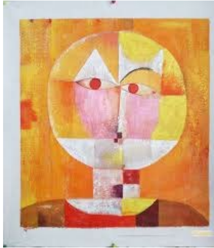
Paul Klee – Senecio 1922

No segundo encontro com a turma naquela universidade, encontrei os estudantes ansiosos em mostrar suas reflexões e textos. O ambiente acadêmico era de fato muito rico, absorvente e produtivo. Havia um clima de profundo desejo de refletir e produzir, o que me deixava muito estimulado. Tive, também, a oportunidade de discorrer sobre o que pensei e produzi, isso nos dava, além de nos assemelhar, a produção em nós de um sentimento de construção do nosso Si e do nosso Outro, assim: