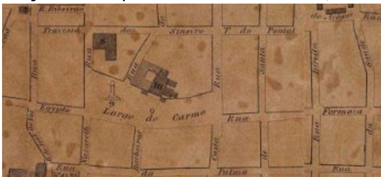
Imagem 1 - Recorte da planta da cidade de São Luís do Maranhão, em 1858