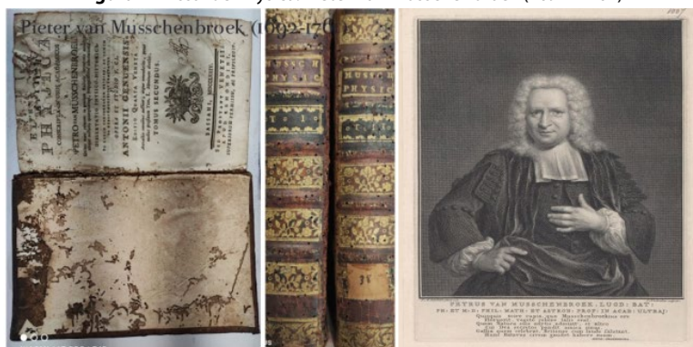
Figura 1 – Essai de Physica. Pieter Van Musschenbroek (1692–1761)

Fonte: Foto do autor (2023). Acervo: Biblioteca Pública Baptista Caetano d’Almeida, São João del-Rei (à esquerda). Pintura de HOUBRAKEN, Jacobus. Pieter van Musschenbroek, 1692 - 1761. Dutch physicist. National Galleries of Scotland (à direita). Disponível em: https://www.nationalgalleries.org/art-and-artists/35903 . Acesso em: 02 jan. 2025.